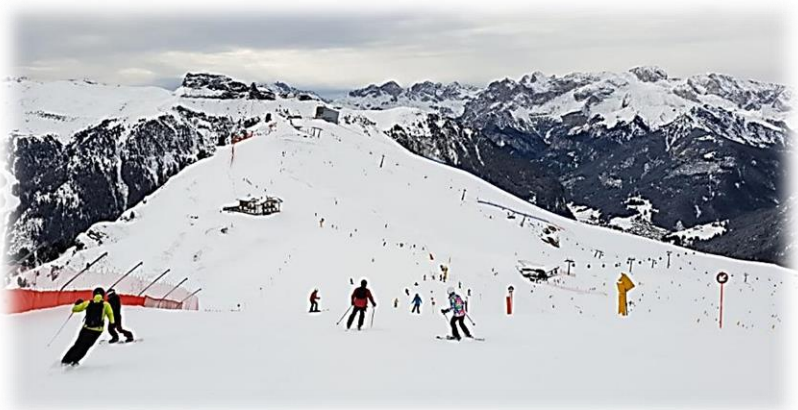
Pisterna i Sella ronda