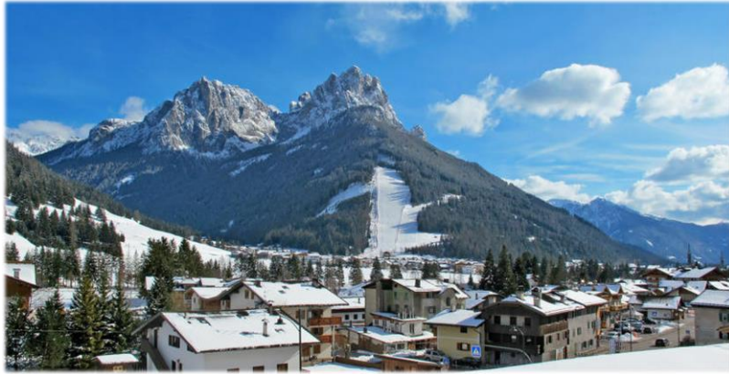
Pozza di fassa