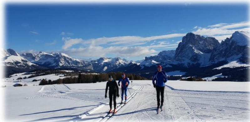
Panoramavyer i Seiser alm