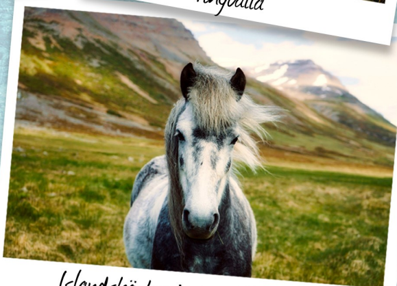
Islandshästar i sin rätta miljö